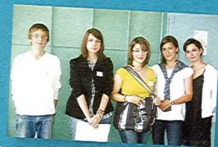
Collège SAINT-LOUIS > Sac qui recharge les portables par l'entreprise MASAFLO-MÉNA