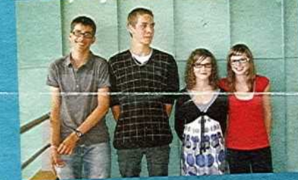
Collège RICHELIEU > Visionnage de films par Internet par l'entreprise MOVIES STAR