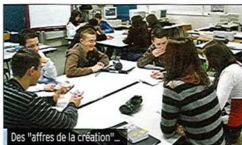
Des "affaires de la création"...

société Oryon et de la Banque Populaire Atlantique. Les collèges Richelieu et Saint-Louis (La Roche-sur-Yon), Puy Chabot (Le Poiré-sur-Vie), Antoine de Saint-Exupéry (Belleville-sur-Vie) et Sainte-Marie (Aizenay) s'étaient mis sur les rangs. Séances de créativité, rencontre de pros de la création et de créateurs, visites d'entreprises, rédaction d'un dossier complet : les jeunes se sont frottés aux réalités de la démarche, avec "une patate d'enfer" : 23 projets ont émergé de leurs cogitations parfois fantaisistes, souvent judicieuses et opportunes !