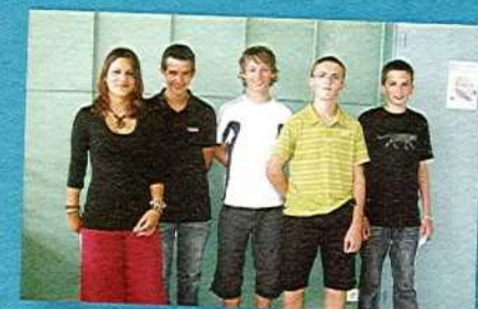
Collège PUY CHABOT > Agenda Scolaire par l'entreprise AS ELECTRONIQUE